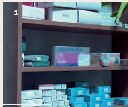
1-Présentation des médicaments

C'est pourquoi, une salle de debriefing est adossée à cet espace de simulation.