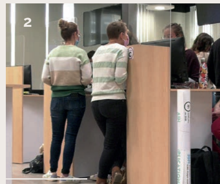
2- Étudiants en situation