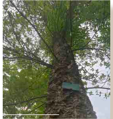
2 - Le chêne liège ( Quercus suber )