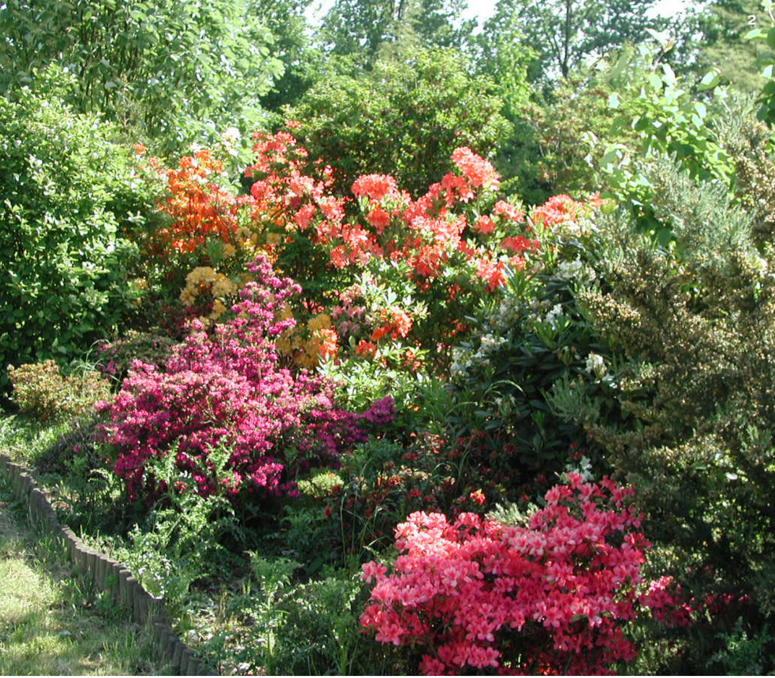
2 - La plante-bande de bruyères et rhododendrons, lors de son optimum en mai