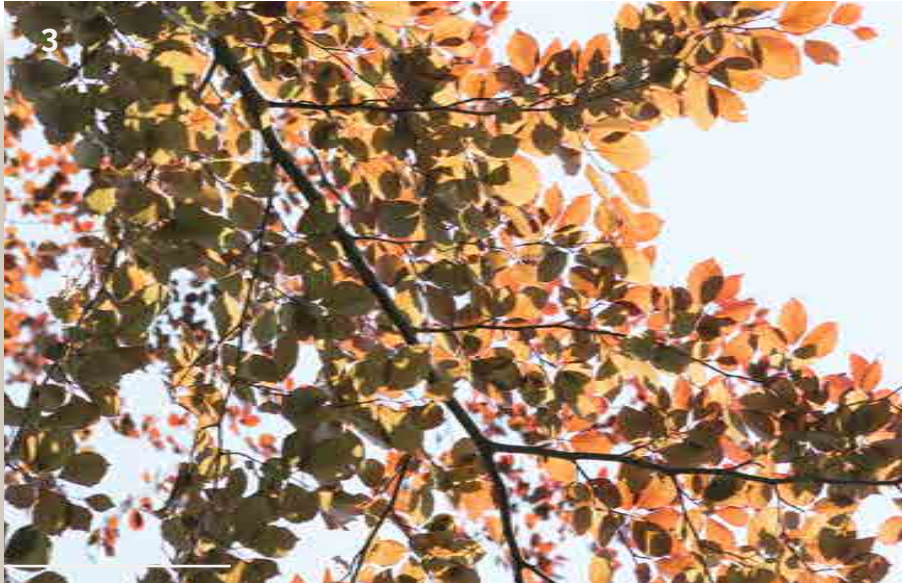
3 - Le bouleau à papier d'Amérique du Nord ( Betula papyrifera )

Constitué à partir de 1984, l'arboretum comporte une quarantaine d'essences remarquables par leur originalité, leur rareté ou leur beauté :