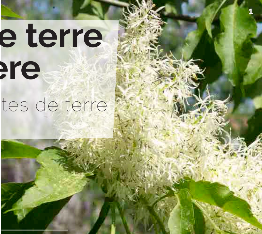
1 - Fothergilla major

Il s'agit en fait d'un massif de plantes de terre de bruyère ; ce substrat remplace ici le sol naturel, beaucoup trop calcaire.