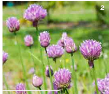
2 - La ciboulette ( Allium schoenoprasum )