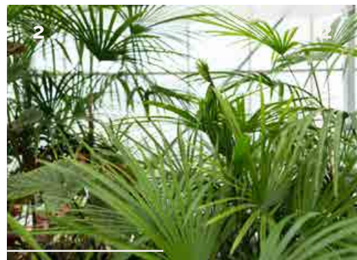
2- La serre