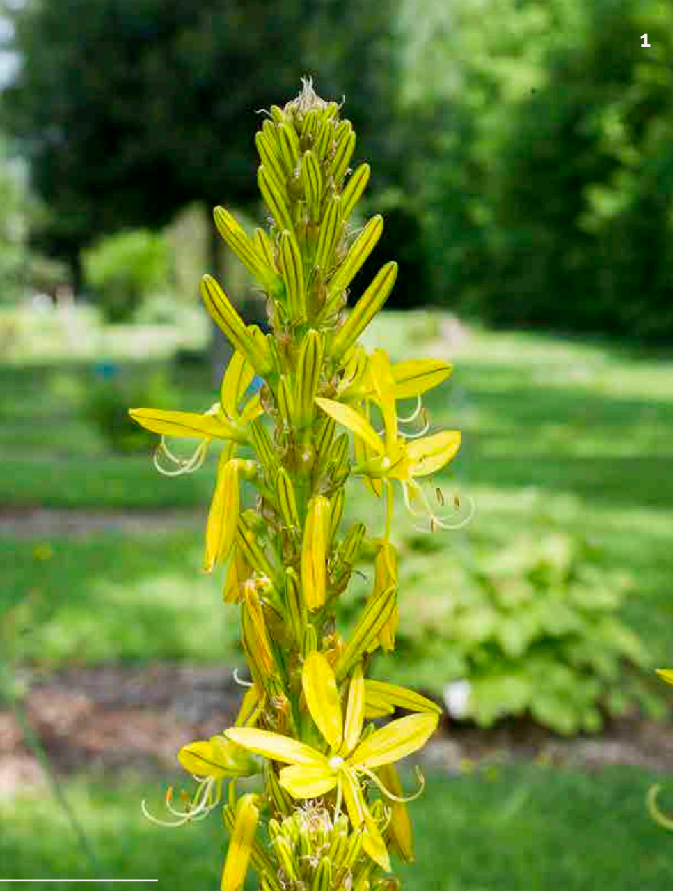
1 - L'asphodéline jaune ( Asphodelina lutea )