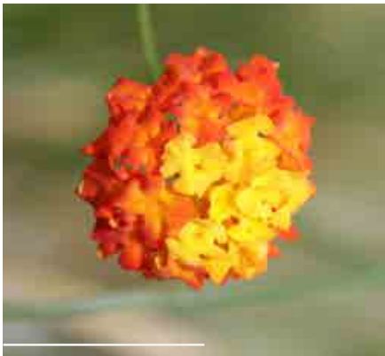
Lantanie ( Lantana camara )

La serre est chauffée (serre tempérée) et couvre 100 m 2 ; elle a été réaménagée en 1995 grâce à des crédits valorisation des collections universitaires attribuées par le ministère de la recherche