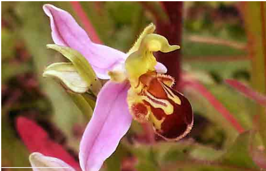
2 - Ophrys abeille ( Ophrys apifera )

Le sol naturellement calcaire et relativement sec, l'absence de traitement herbicide et la tonte espacée ont favorisé le semis spontané d'orchidées sauvages.