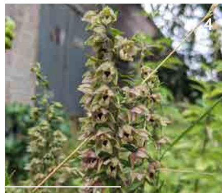
4 - Orchidée ( Epipactis helleborine )