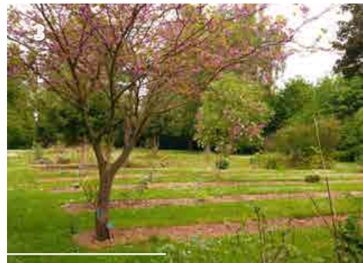
3- Plats bandes de l'école de botanique avec au premier plan l'arbre de Judée ( Cercis siliquastrum )