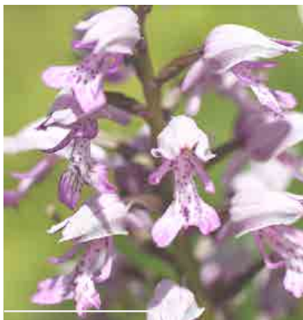
1 - Orchis guerrier ( Orchis militaris ),